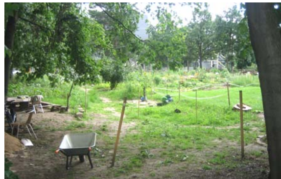
Abbildung 4: Internationaler Garten, Pfortenhauerstraße 103, Gleisschleife Johannstadt.

→ Die verschiedenen Projekte zeigen den Bedarf und die Spielräume für Gartenprojekte in der Stadt Dresden auf.