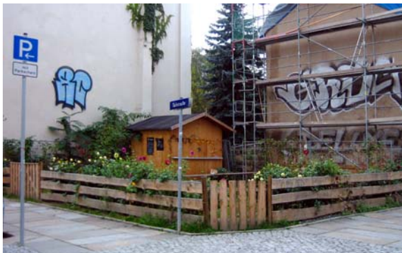
Abbildung 3: Gemeinschaftlich genutzte Baulücke in der Äußeren Neustadt durch die Bürgerinitiative Kamenzer Straße (Foto: S. Rößler).