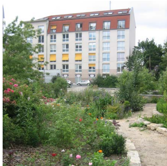
Abbildung 2: „Vietnamesengärten“ an der Pfortenhauerstraße 45.

Für die gärtnerische und gemeinschaftliche Nutzung von Brachflächen gibt es in der Stadt Dresden bereits Beispiele, welche von schon erfolgreich umgesetzten Projekten (siehe Abbildung 2 bis Abbildung 4; Tabelle 13 im Anhang) bis hin zu ersten Ideen und Initiativen reichen (Brache Talstraße, Bürgerinitiative Kamenzer Straße oder Anwohnergärten Pieschen, +sowieso+ Frauen für Frauen e. V). Auf einigen Flächen gibt es auch bereits Bemühungen, die Potenziale älterer Brachflächen als Sukzessionsstandorte mit einem wertvollen Arteninventar zu schützen und als Naturerlebnisräume zu entwickeln (Lehmgrube Coschütz).